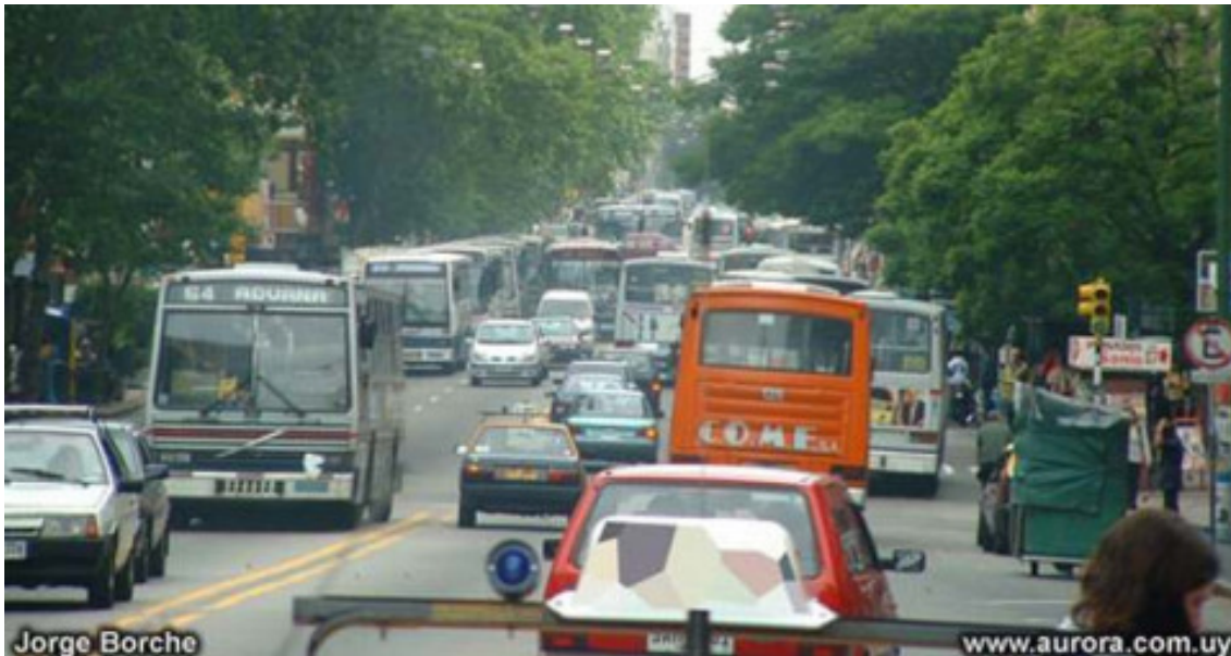
Duas fotos da Av. 18 de Julio em Montevideú

No fundo, o verdadeiro motivo dos projetistas terem começado a recorrer ao estágio exclusivo de pedestres é que não encontraram alternativa. Como, no Brasil, não se respeita a prioridade do pedestre no movimento de conversão, essa é a única forma de garantir sua travessia com segurança. É imprescindível, porém, que tenhamos consciência de que essa solução é um quebra-galho. O pior, eu acho, é que o estágio de pedestres passou a ser encarado, em muitos meios técnicos, como a solução ideal. Cheguei a assistir, perplexo, um colega afirmar, numa entrevista, que a situação ideal seria que todos os cruzamentos tivessem tal estágio!!